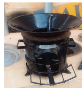
Photo 1: Types de fourneaux à charbon [a) fourneau traditionnel, b) fourneau amélioré, c) fourneau moderne].