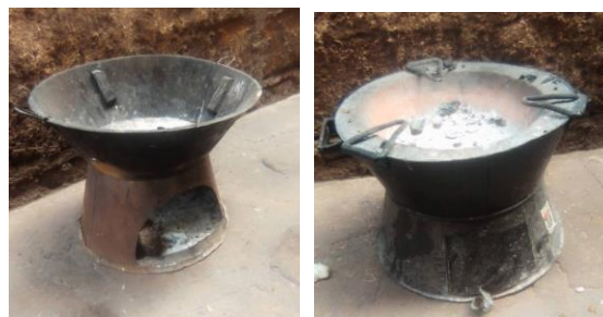
c) fourneau moderne

a) fourneau traditionnel b) fourneau amélioré